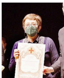
Centro culturale Cabrini