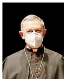
Monsignor Egidio Miragoli